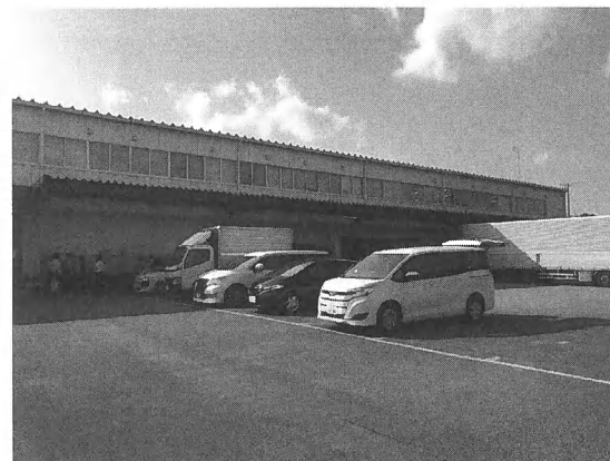
写真5 購入した倉庫

当社では昨年、三重県において約1,000坪の倉庫物件を購入した（写真5、6）。自ら倉庫オーナーになる経験をする、また、投資対象としての物