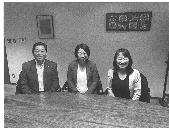
写真6 物件の売主と

流不動産の可能性を探ることを目的とした実験的な試みである。物件選定にあたっては、物流不動産の目利きができる当グループのノウハウをフル活用して物件探しや収益シミュレーションを行った。空室リスクに対しても、相場賃料や新規テナントの見通し、自社利用の可能性まで検討した。