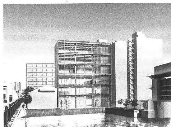
写真2 計画中のマルチパーパス倉庫

こうして開発を進めたマルチパーパス倉庫は、オーナー、テナント双方にとってWin-Winのメリットを享受できる建物となる（写真2）