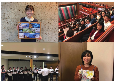
▲ 左上：ビジョンボード作成、右上：歌舞伎鑑賞、左下：合唱団、右下：カップ絵付け教室