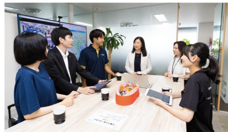
▲コミュニケーションエリアでは、快活に意見を交わし合うこともしばしばです。